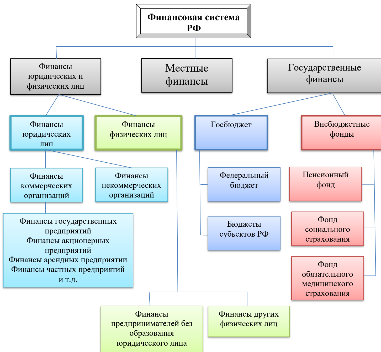
Рис. 2. Финансовая система Российской Федерации

В соответствии со ст. 106 Конституции Российской Федерации, представительные органы в лице Федерального Собрания Российской Федерации и представительные органы субъектов Федерации рассматривают, обсуждают и утверждают федеральный бюджет, бюджет республик, входящих в состав Российской Федерации. На основании положений статьи 114 Конституции РФ Правительство Российской Федерации: